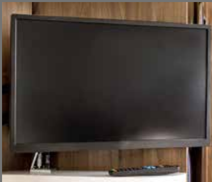
Flachbildschirm 24 Zoll