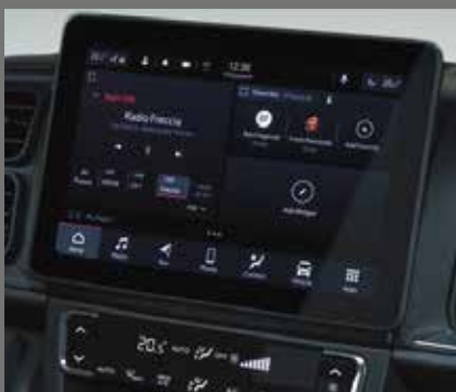
10-Zoll-Radio mit Navigationssystem