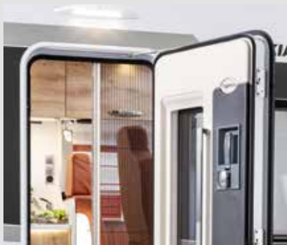
Praktischer Schutz: in der Aufbau­tür integriertes Fliegengitter