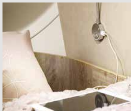
In jedem FRANKIA Wohnmobil: mehrere praktische USB-Steckdosen