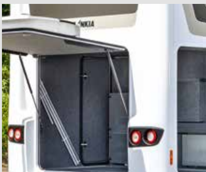
Be- und Entladen der Garage durch verstellbare Heck- und Seitenklappen