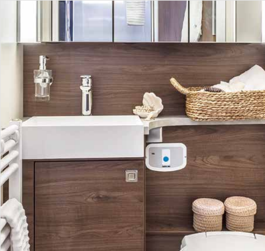
Edel erfrischen: hochwertige Armaturen im FRANKIA Wellnessbad