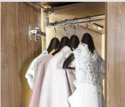
Geräumige Kleiderschränke mit angenehmer Innenbeleuchtung