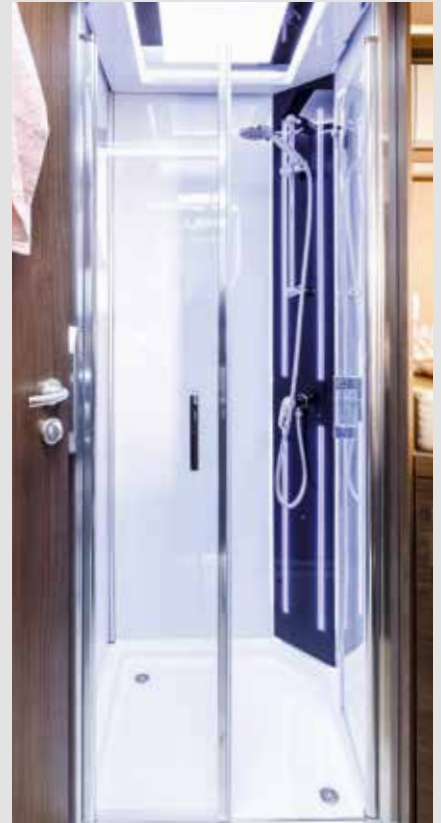
Duschkabine mit Ambientebeleuchtung