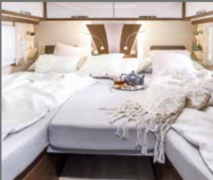
Viel Platz: Bettenverbreiterung für getrennte Betten (GD)