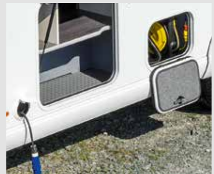
Selbstaufrollende Kabeltrommel mit 15 m Kabel und Zentralversorgung