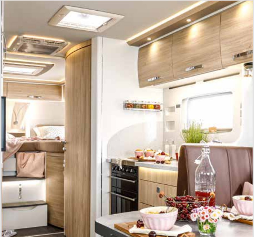
Für jede Stimmung passend: die dimmbare LED-Beleuchtung