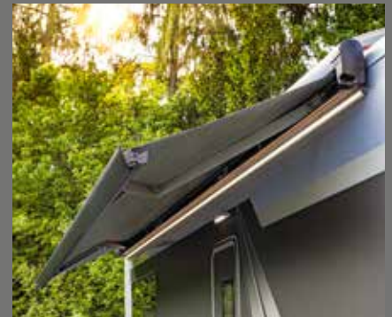
Markise – optional mit integriertem LED-Beleuchtungsprofil