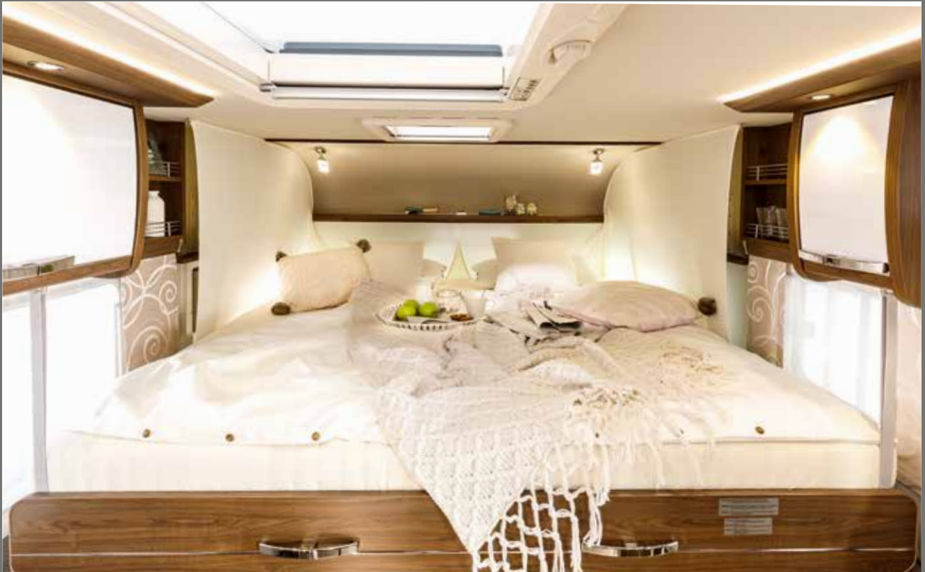
Ideal für Quer- und Längsschläfer: ausziehbares FRANKIA Duo-Bett (2 x 2 m)

Sonderausstattung der FRANKIA F-Line (Auswahl)