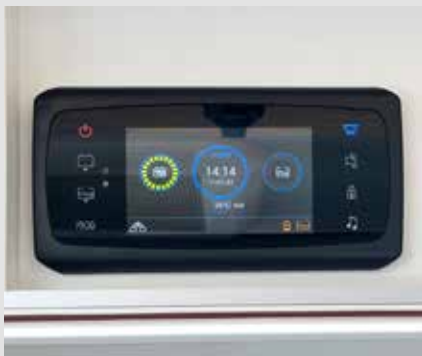
Zentrale Steuerung – gut sichtbar und einfach zu bedienen