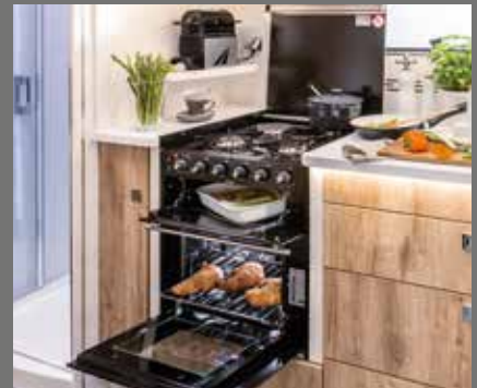
Küchensäule/Herkombination (mit Grill, Gasbackofen, 3-Flamm-Kocher)