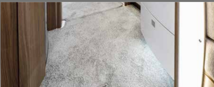
Pflegeleichter Teppichboden im gesamten Innenraum