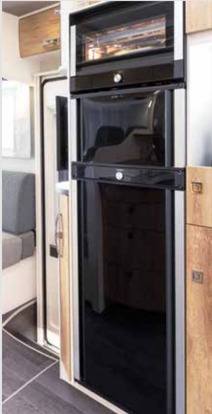
Kühlschrank und Gefrierfach im TecTower beidseitig zu öffnen (grundrissabhängig)

Serienausstattung der FRANKIA F-Line (Auswahl)