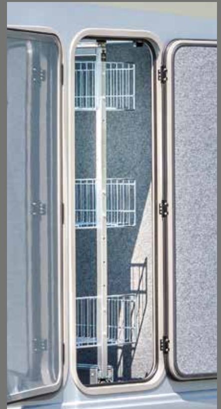
Komfortabler und praktischer Apothekerauszug für die Garage