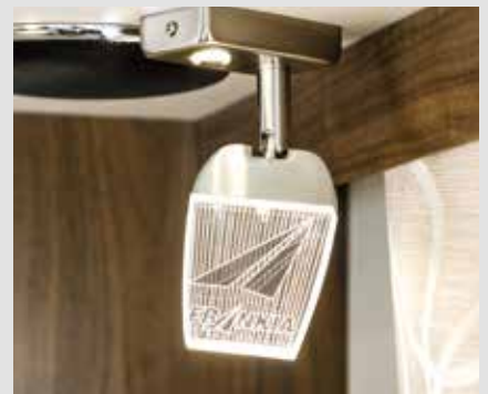
Dimmbare Leseleuchten im FRANKIA Design mit Nachtlicht-Funktion