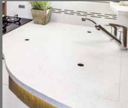
Pflegeleichte Küchenplatte – z. B. aus hochwertigem Mineralwerkstoff