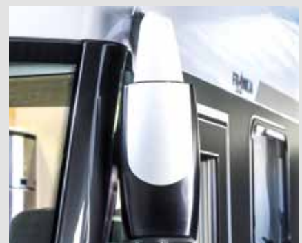
Außenspiegel elektrisch verstell- und beheizbar

* Siehe wichtige Informationen zu den technischen Daten auf Seite 30.