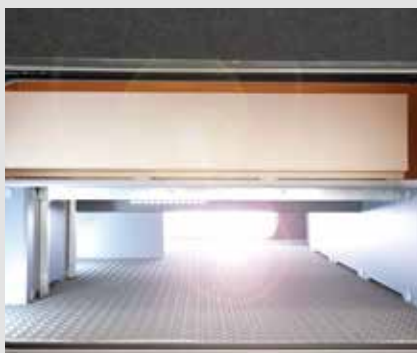
FRANKIA Doppelboden: stufenlos durchgehend 35 cm Höhe, beheizt