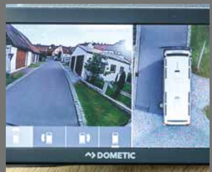
Alles im Blick: Bird-View-Cam mit 360°-Sicht und großem Display

* Siehe wichtige Informationen zu den technischen Daten auf Seite 30.